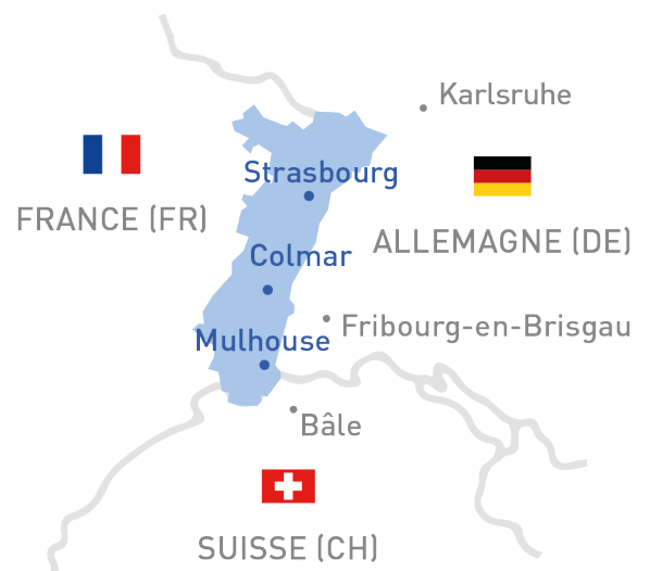
Carte de l'Eucor – le campus européen http://www.eucor-uni.org/fr