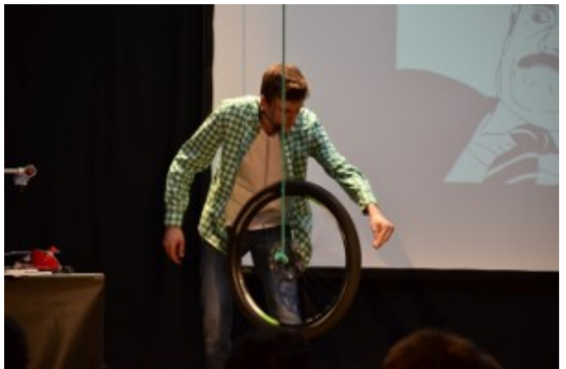
Le premier exposé lors du premier science slam franco-allemand en 2014