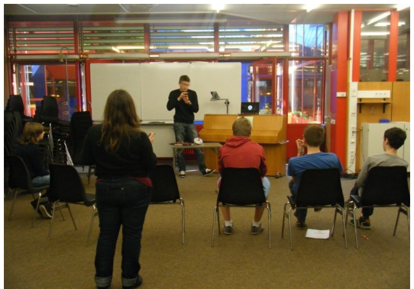
Stage de mise en scène – Mars 2014

Programm: Jedes Treffen beginnt mit körperlichen Aufwärmübungen sowie Konzentrationsübungen. Je nach Schwerpunkt des Treffens (Stimme, Körperpräsenz o. a.) werden kleinschrittig, durch theaterpädagogische Methoden die anvisierten Kompetenzen trainiert, sowie jeweils erste szenische Übungen angesetzt. Ein Feedback bildet den Abschluss eines Workshops.