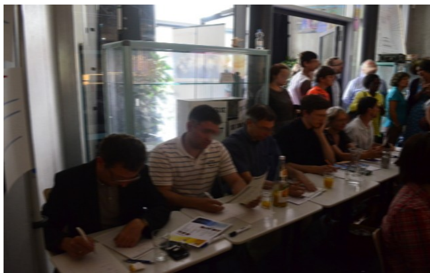
Jury scientifique lors du science slam franco-allemand 2015 : Deux parents scientifiques, un chercheur, un élève de terminale et deux enseignants

III.4 L'autocritique et les améliorations possibles