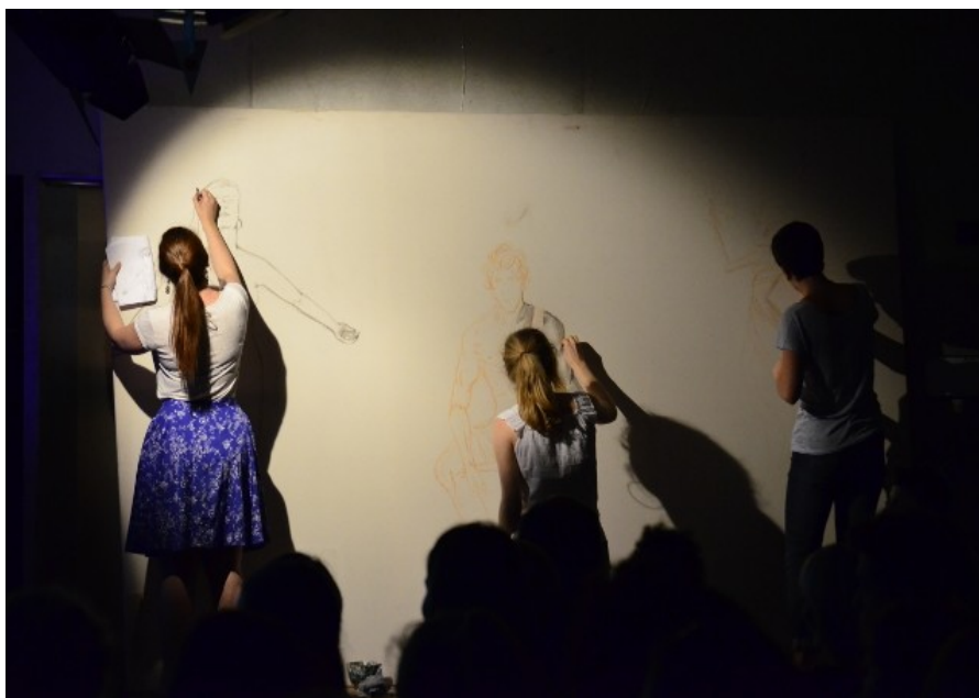
Illustration des exposés en direct lors du science slam franco-allemand 2015

II.5 Les candidats et les thèmes proposés